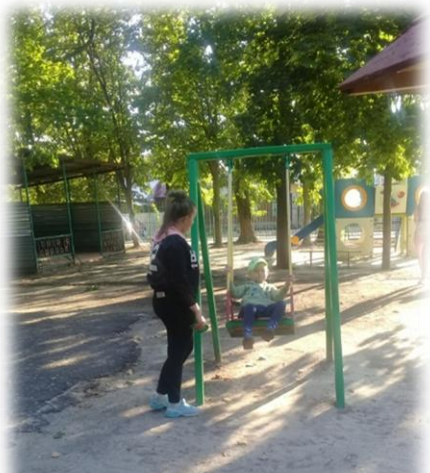
Целевая прогулка по улицам, скверам, паркам города