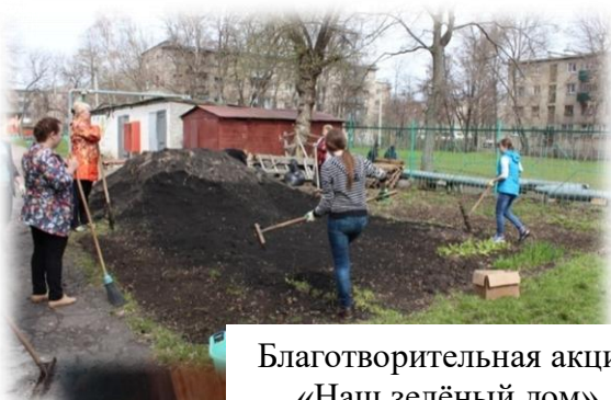
Благотворительная акция «Наш зелёный дом»