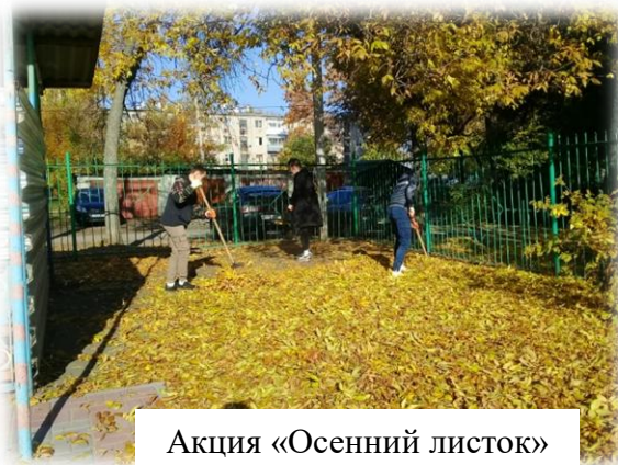
Акция «Осенний листок»