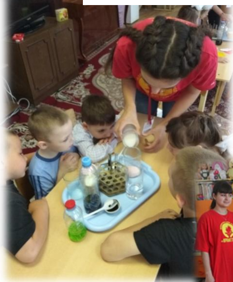
Урок культуры и здоровья «Здоровое питание»