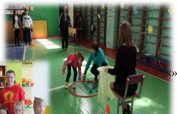
Проведение спортивного мероприятия «Быстрее. Выше. Сильнее».