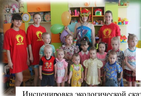
Инсценировка экологической сказки «Юные спасатели природы»