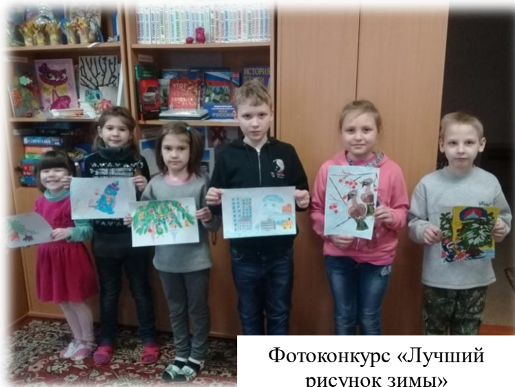
Фотоконкурс «Лучший рисунок зимы»